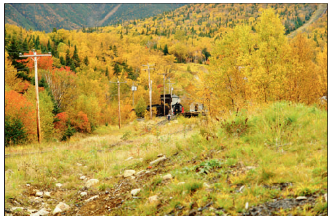
LGB-Tours Reise in den Osten der USA, ab Seite 66