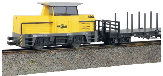
Die neueste Generation des Playmobil Eisenbahnsystems ist seit kurzem im Handel. Wir haben das funkferngesteuerte Lokmodell mit Sound und Licht unter die Lupe genommen. Seite 12