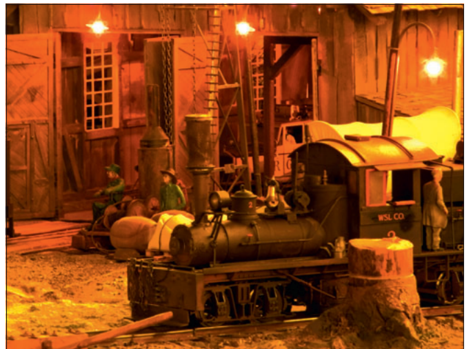
Eine Westernstadt für die WSL&Co., ab Seite 46