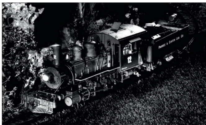
Tipps und Tricks für Aufnahmen der Gartenbahn bei Nacht, ab Seite 94