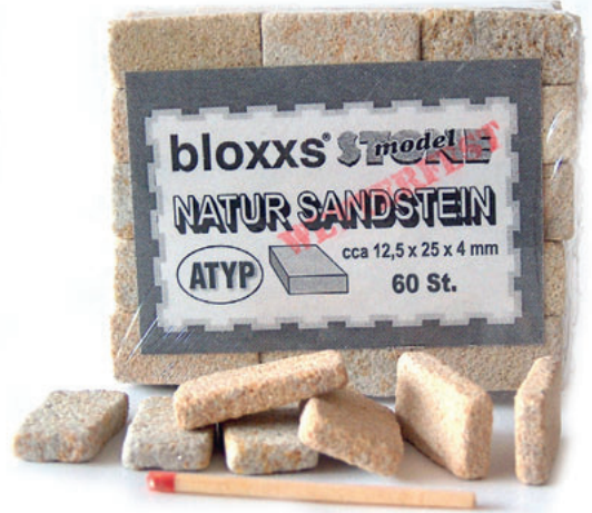
bloxxs Sandsteine „Made in Tschechien“, ab Seite 6