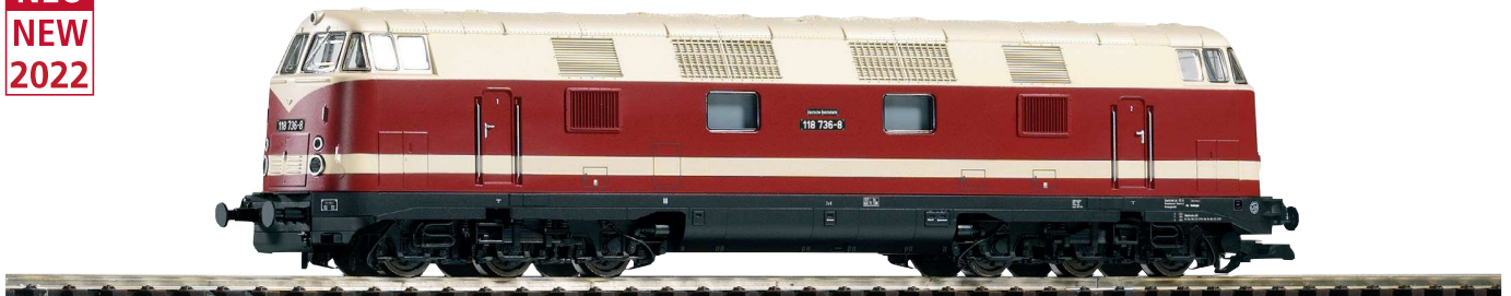
37571 Diesellokomotive BR 118 6achsiger DR Ep. IV, mit Sound