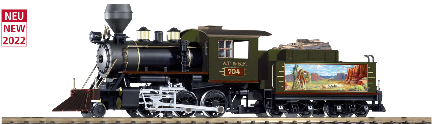
38233 Dampflokomotive Mogul SF, mit Sound und Dampf