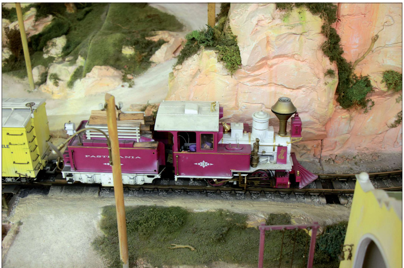
Himbeerfarbige US Westernlok mit Tender. Der violette Heizer ist leider umgefallen und am Tender ging der Handlauf verloren. Nach so vielen Jahren läuft die LGB Lok immer noch zuverlässig ihre Runden.

Auf der Pastelania Anlage sind drei US Züge unterwegs. Die modifizierten Modellhäuser und teilweise geänderten Figuren sind ebenfalls im Viktorianischen Stil gehalten. Alles soll Anfang des 19. Jahrhunderts dargestellt sein. Viele De-