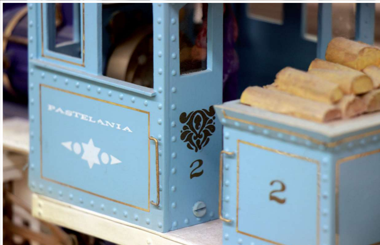
Detailaufnahme der hell-/dunkelblauen Forney Stütztenderlok im Eigenbau. Führerstand und Holztender sind auf einer Rahmenplatte mit Abstand montiert.

Der Traum wurde Wirklichkeit und die beschriftete Märchenbahn mit dem Phantasienamen Pastelania ist immer noch im Einsatz. Wie, aus den Bildern erkennbar, fahren die violette Mogul Dampflok (entweder Art. Nr. 2018 oder Art. Nr. 2028), die himbeerfarbene Western LGB mit Tender (Art. Nr. 2016 oder 2017) und die himmelblaue, in Eigenbau entstandene, Stütztenderlok Forney mit dunkelblauem Kessel. (Hierzu konnte in den einschlägigen LGB Almanachen keine passende Art. Nr. gefunden werden. Die Forney wurde erst ab 1992 gebaut und hatte eine geschlossene Kabine. Somit ist dies ein kompletter Eigenbau aus verschiedenen Teilen.)