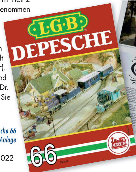
Titelbild der LGB Depesche 66 3. Quartal 1990 – Die Pastelania Anlage

Text über die Vorstellung und den Aufbau der Pastelania Anlage in der LGB Depesche Nr. 64 auf Seite 54 und 55 aus 1990, 1. Quartal.