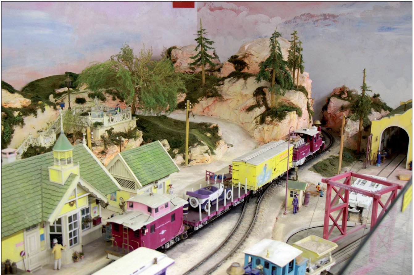
Übersicht über den Bahnhof mit Ausfahrt des himbeerfarbenen Zuges in den seitlichen Tunnel.