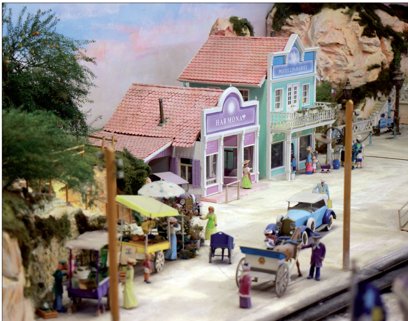
Marktplatz und Häuser, eigens gestaltet und in Pastellfarben angemalt.

kräftigen Farben ihre Intensität und verwandelt sie in gut gelaunte Pastellfarben. Diese Farbwelt kam im Jahre 2020 wieder in die Wohnungen zurück.