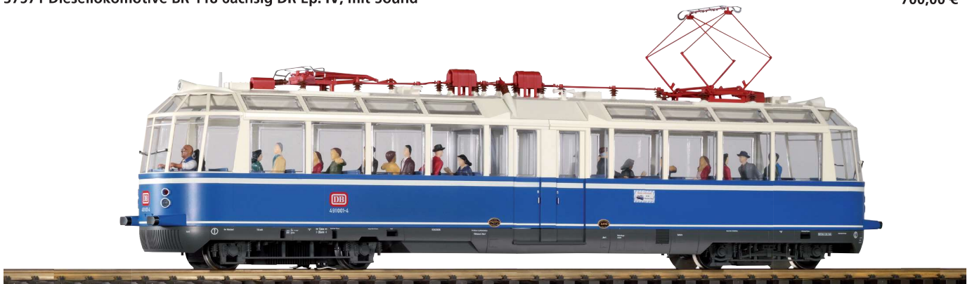
37331 Elektrotriebwagen BR 491, Gläserner Zug, DB, Ep. IV, mit Sound