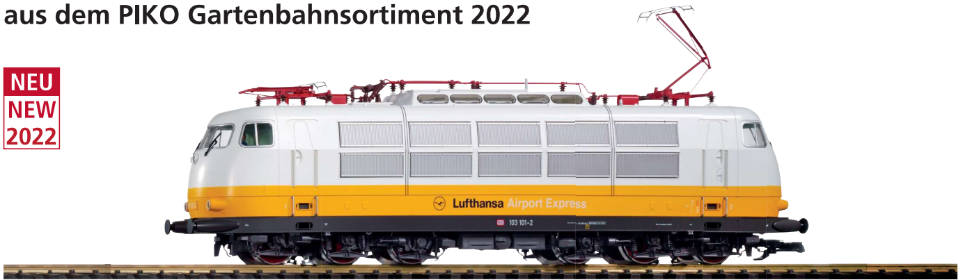
37443 Elektrolokomotive BR 103 Lufthansa DB Ep. IV, mit Sound